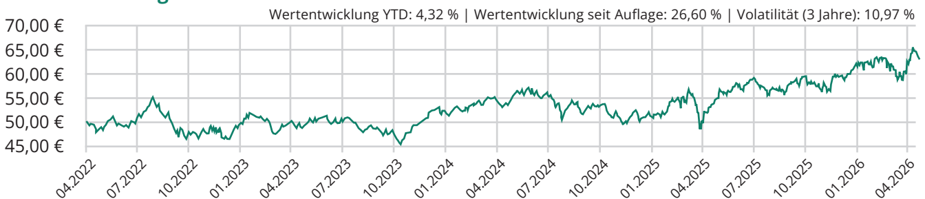
Chart seit Auflage

Die hier dargestellte Bruttowertentwicklung (BVI-Methode) berücksichtigt bereits alle auf Fondsebene anfallenden Kosten (z.B. die Verwaltungsvergütung), die Nettowertentwicklung zusätzlich den Ausgabeaufschlag. Da der Ausgabeaufschlag nur im 1. Jahr anfällt, unterscheidet sich die Wertentwicklung brutto | netto nur in diesem Jahr. Weitere Kosten können auf Kundenebene individuell anfallen (z.B. Depotgebühren). Modellrechnung (netto): Ein Anleger möchte für 1.000,00 EUR Anteile erwerben. Bei einem Ausgabeaufschlag von 3,00% muss er dafür 1.030,00 EUR aufwenden. Zusätzlich können Depotkosten anfallen. Die Wertentwicklungen in der Vergangenheit stellt keinen Indikator für die laufende oder zukünftige Wertentwicklung dar. Der zukünftige Anteilswert kann gegenüber dem Erwerbszeitpunkt steigen oder fallen.