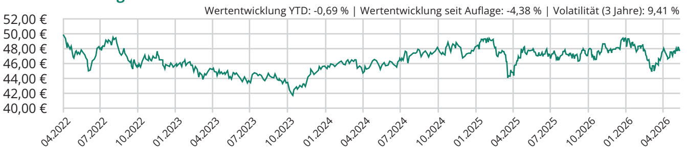
Chart seit Auflage

Die hier dargestellte Bruttowertentwicklung (BVI-Methode) berücksichtigt bereits alle auf Fondsebene anfallenden Kosten (z.B. die Verwaltungsvergütung), die Nettowertentwicklung zusätzlich den Ausgabeaufschlag. Da der Ausgabeaufschlag nur im 1. Jahr anfällt, unterscheidet sich die Wertentwicklung brutto | netto nur in diesem Jahr. Weitere Kosten können auf Kundenebene individuell anfallen (z.B. Depotgebühren). Modellrechnung (netto): Ein Anleger möchte für 1.000,00 EUR Anteile erwerben. Bei einem Ausgabeaufschlag von 3,00% muss er dafür 1.030,00 EUR aufwenden. Zusätzlich können Depotkosten anfallen. Die Wertentwicklungen in der Vergangenheit stellt keinen Indikator für die laufende oder zukünftige Wertentwicklung dar. Der zukünftige Anteilswert kann gegenüber dem Erwerbszeitpunkt steigen oder fallen.