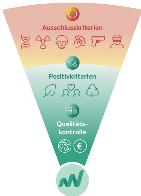
Portfolio der UmweltBank Fondsfamilie