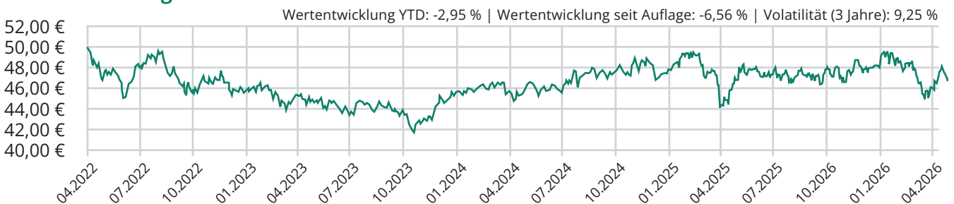
Chart seit Auflage

Die hier dargestellte Bruttowertentwicklung (BVI-Methode) berücksichtigt bereits alle auf Fondsebene anfallenden Kosten (z.B. die Verwaltungsvergütung), die Nettowertentwicklung zusätzlich den Ausgabeaufschlag. Da der Ausgabeaufschlag nur im 1. Jahr anfällt, unterscheidet sich die Wertentwicklung brutto | netto nur in diesem Jahr. Weitere Kosten können auf Kundenebene individuell anfallen (z.B. Depotgebühren). Modellrechnung (netto): Ein Anleger möchte für 1.000,00 EUR Anteile erwerben. Bei einem Ausgabeaufschlag von 3,00% muss er dafür 1.030,00 EUR aufwenden. Zusätzlich können Depotkosten anfallen. Die Wertentwicklungen in der Vergangenheit stellt keinen Indikator für die laufende oder zukünftige Wertentwicklung dar. Der zukünftige Anteilswert kann gegenüber dem Erwerbszeitpunkt steigen oder fallen.