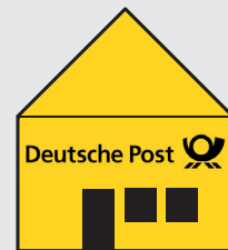
Postfiliale Ihrer Wahl