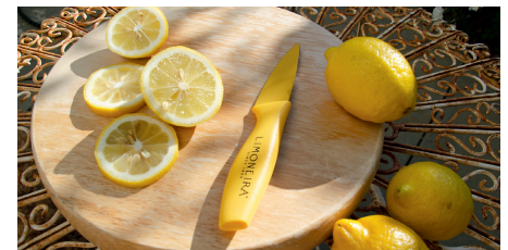
Unternehmen im Fonds: Summerset Group (Seniorenresidenzen), Össur (Prothesen), Limoneira (Zitrusfrüchte)

Thermo Fisher, Medtronic, Edwards Lifesciences, MesaLabs). Auch in die neuseeländischen Altenheimbetreiber Arvida und Summerset Group sowie die auf ärmere Menschen ausgerichteten US-Krankenversicherer Molina Healthcare, Centene und Humana investiert der Umweltspektrum Mensch. Nach ECoReporter-Recherchen verstößt keines der zum Testzeitpunkt 67 Unternehmen gegen die Nachhaltigkeitsgrundsätze des Fonds. Die UmweltBank bewertet das Umwelt- und Sozialverhalten der Unternehmen selbst. Ergänzende Daten liefert die Nachhaltigkeits-Ratingagentur ISS ESG (vormals ISS-oekom). Als Fondsberater fungiert die EB-SIM, die Investment-Tochter der Evangelischen Bank. Der mit externen Expertinnen und Experten aus den Bereichen Wirtschaftsethik und nachhaltige Projektentwicklung besetzte Umweltrat der UmweltBank hat die Anlagekriterien des Fonds mitentwickelt und kontrolliert, ob sie eingehalten werden.