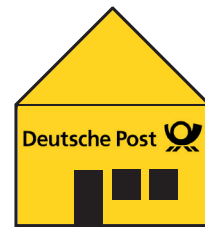
Postfiliale Ihrer Wahl