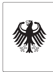
Personalausweis oder Reisepass